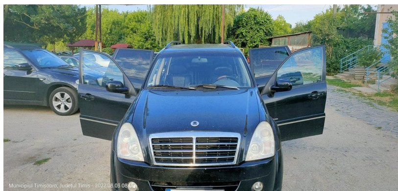
Municipiul Timisoara, Judetul Timis - 2022.08.03 08:10